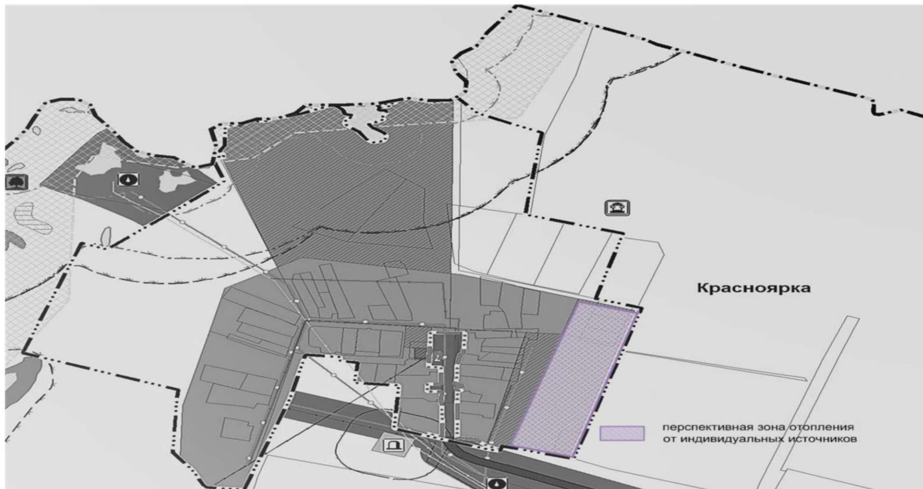
Рисунок 3 - п. Красноярка с площадками перспективного строительства под жилую зону