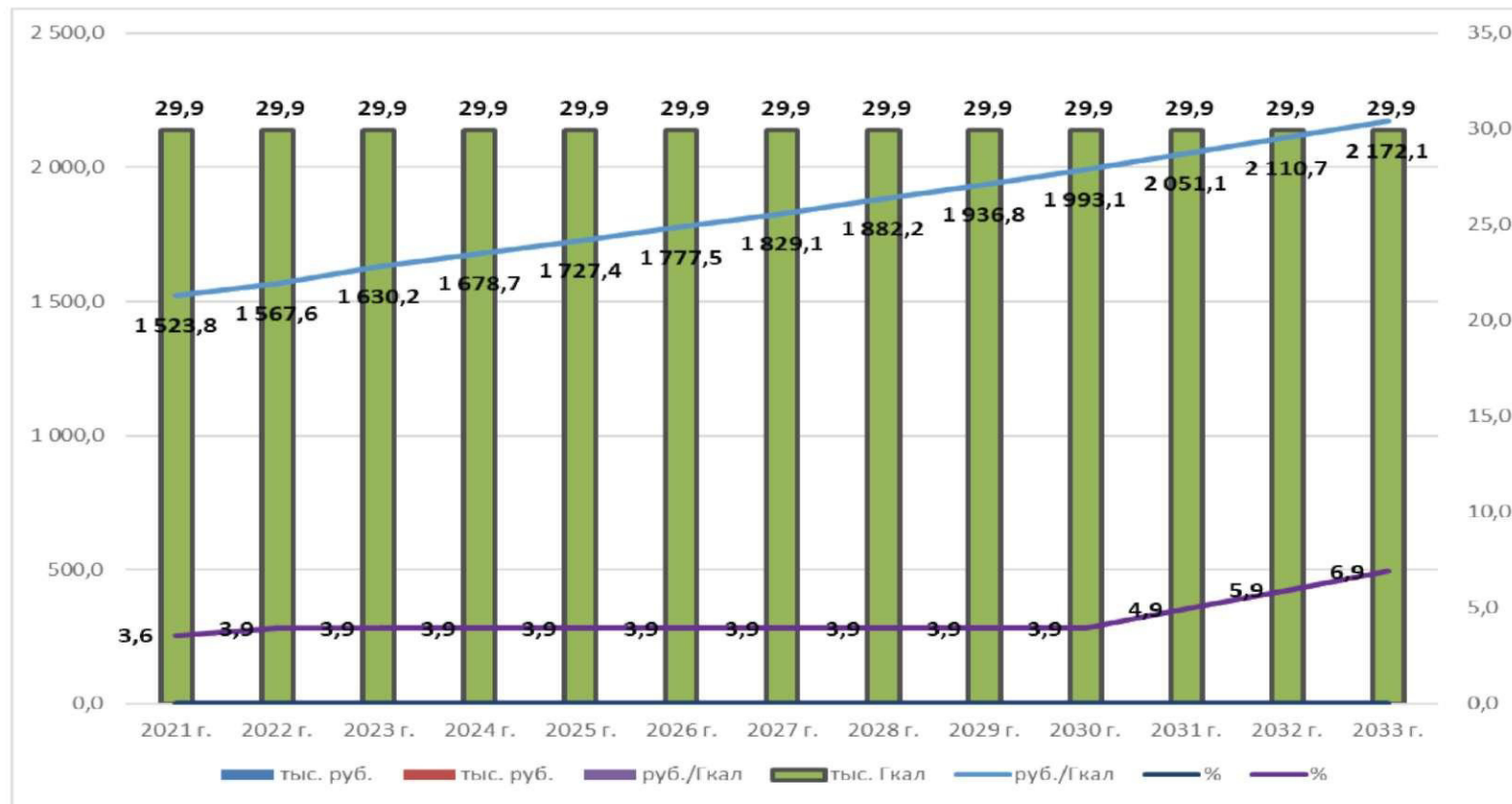
Рисунок 7-Влияние инвестиционной составляющей на тариф на теплоснабжение в регулируемом периоде 2022-2033 гг.