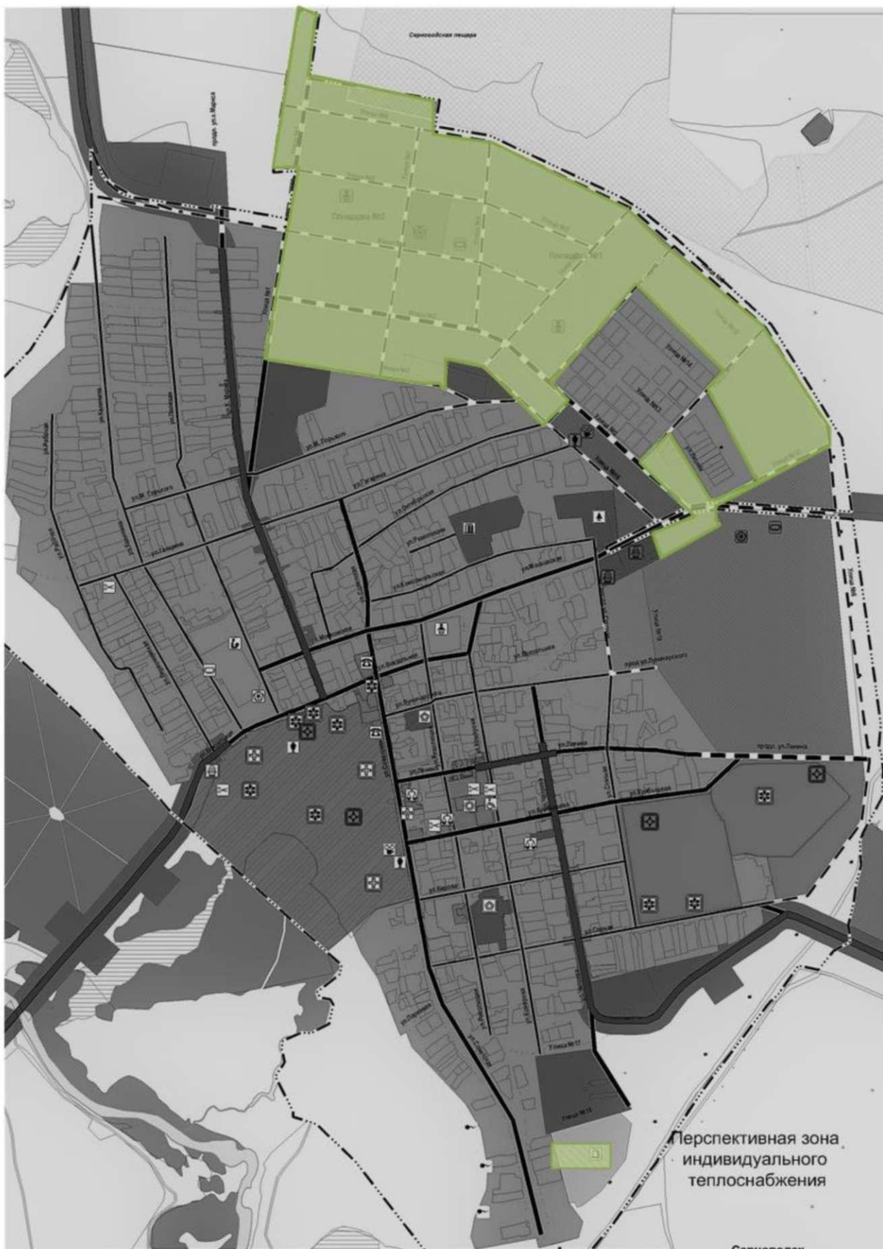
Рисунок 5 – Перспективные зоны индивидуального теплоснабжения с.п. Серноводск