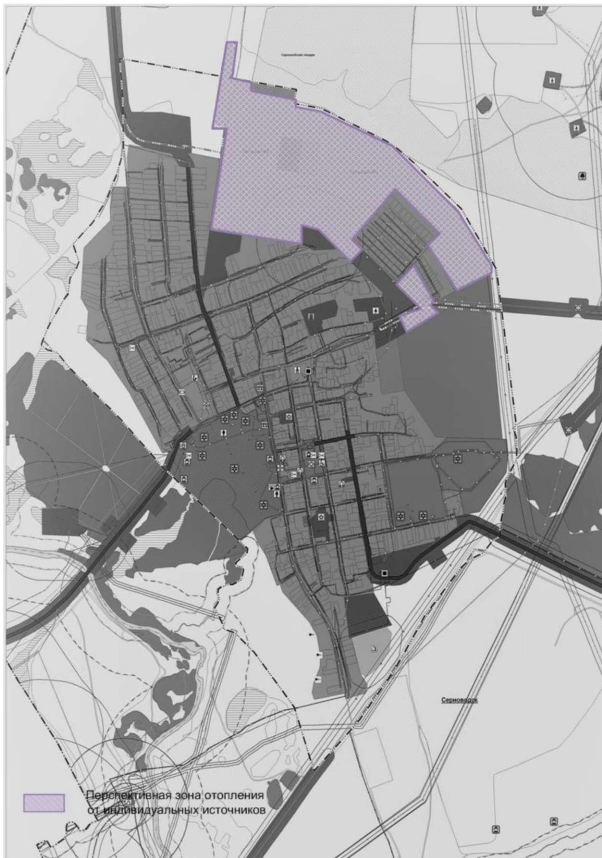
Рисунок 2 - п. Серноводск с площадками перспективного строительства под жилую зону

Территории с.п. Серноводск с площадками перспективного строительства под жилую зону представлены на рисунках 2-3.