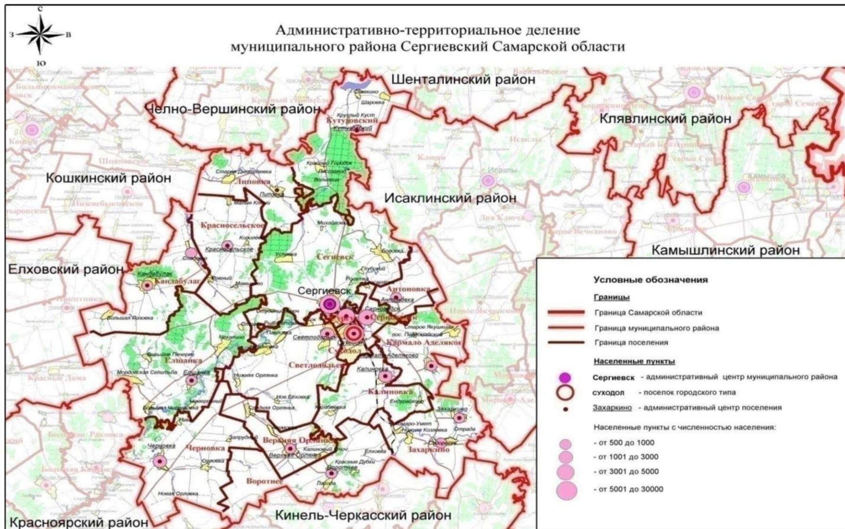
Рисунок 1 - Расположение с. п. Серноводск